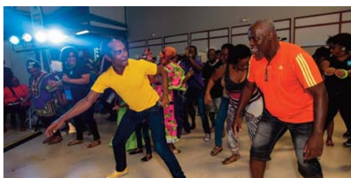
Des partenaires santé, sportif et artistique unis pour la prévention