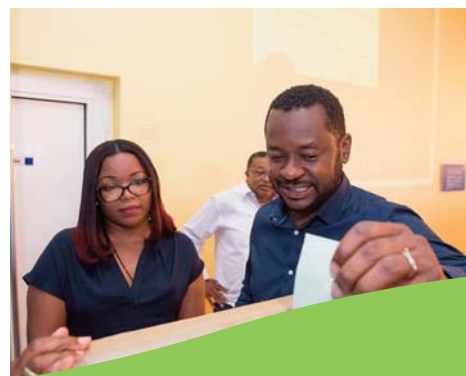
L'assemblée générale du 25 mars 2018 qui a réuni les délégués de Guadeloupe et Martinique