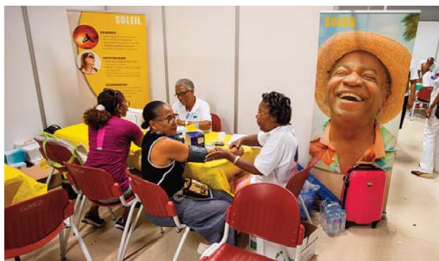
Des participants au forum reçus par les membres de la Ligue Vie et Santé