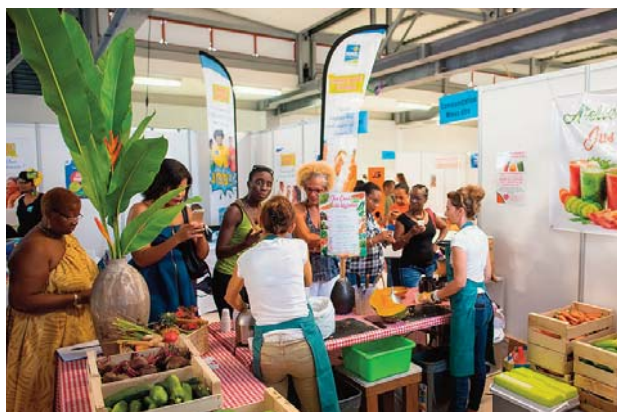
Un public assoiffé d'informations sur la richesse de nos produits locaux

Ils sont repartis avec un bilan santé complet... et beaucoup de bonnes résolutions.